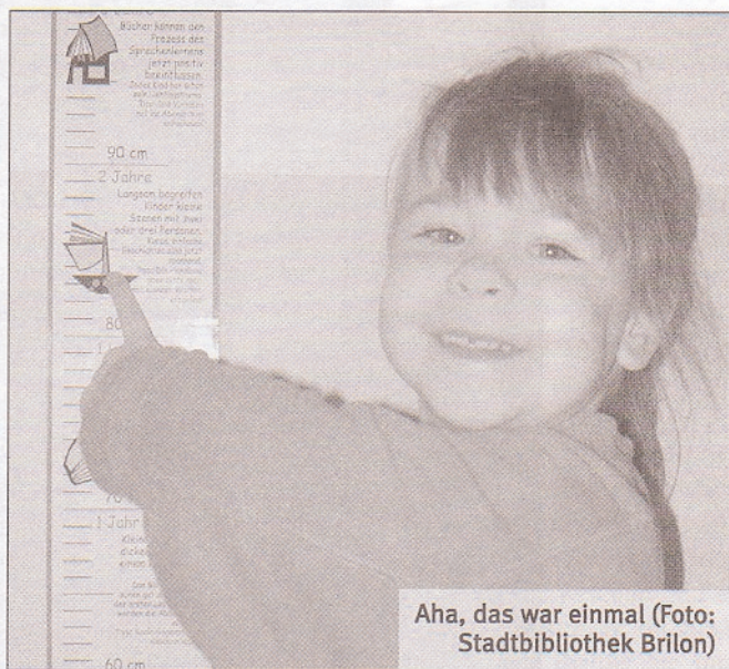
Aha, das war einmal

Auf den ersten Blick ist die Leselatte eine gewöhnliche, farbig illustrierte Plackstik-Messlatte mit Zentimeterangaben für Kinder im Alter bis zehn Jahren, wie sie aus den meisten Kinderzimmern bekannt sein dürfte. Auf den zweiten Blick informiert die Latte zu jeder Altersstufe über Fördermöglichkeiten der Lesekompetenz von Kindern. So ist beispielsweise für die Größe von 90 cm zu lesen: »Langsam begreifen Kinder kleine